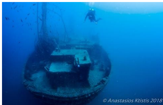
1. Το ναυάγιο του φορτηγού πλοίου Χριστόφορος (1983).

δραστηριότητας από την αρχαιότητα μέχρι σήμερα, έχουν εντοπιστεί τουλάχιστον 150 ενάλιες οικιστικές θέσεις iii . Η πρόσφατη ανακάλυψη στη Μαύρη Θάλασσα ενός ακέραϊου ναυαγίου 2.500 ετών σε μεγάλο βάθος iv επιβεβαιώνει όχι μόνο τον σημαντικό πολιτιστικό πλούτο που παραμένει κρυμμένος στο βυθό, αλλά επιπλέον το αυξανόμενο ενδιαφέρον του κοινού για τα εντυπωσιακά αυτά ευρήματα.