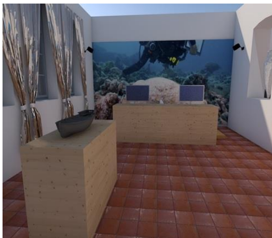
4. Κέντρο Ενημέρωσης και Ευαισθητοποίησης του Κοινού. Μακέτα σχεδίου, ΚΑC Αλοννήσου.

ίδιο πλαίσιο εντάσσεται και η σύνδεση του έργου οριζόντια με το BlueTourMed xiii προκειμένου οι δράσεις που αναπτύσσονται στο πλαίσιο του BLUEMED να έχουν προβολή και αλληλεπίδραση σε διεθνή κλίμακα.